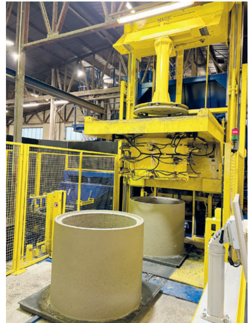
Производство доборных колец на установке Magic 1501

ной системой для изготовления бетонных изделий для гражданского строительства и используется на бетонных производствах по всему миру. Schlüsselbauer Technology предлагает две версии Magic: Magic 1501 и Magic 2500 для производства крупноформатных доборных колец. Кроме того, заказчик может выбрать одну из двух концепций системы: автономную машину с ручной или полностью автоматизированной транспортировкой изделий. Компания Kühne выбрала Magic 1501 в качестве отдельной установки. Из-за ограниченного пространства другая концепция была бы неосуществима. Производственные цеха полностью заняты, и на нынешнем месте у фирмы нет возможности дальнейшего расширения производственных площадей. Magic 1501 – это производственная система для изготовления элементов колодцев, таких как доборные кольца и эксцентриковые конусы высотой до 1 500 мм, а также различных бетонных элементов для гражданского строительства. Машина позволяет изготавливать до шести сборных элементов в одном или нескольких экземплярах и рассчитана на максимальный размер изделий с наружным диаметром до 1 800 мм. Компания Kühne использует установку Magic 1501 для производства доборных колец и конусов колодца.