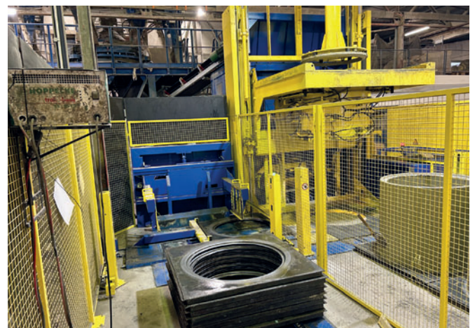
Автоматическая подача поддонов