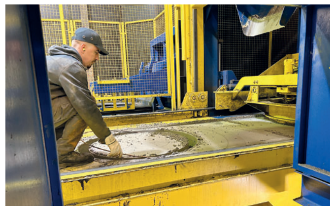
Установка армирующего кольца при изготовлении доборного кольца