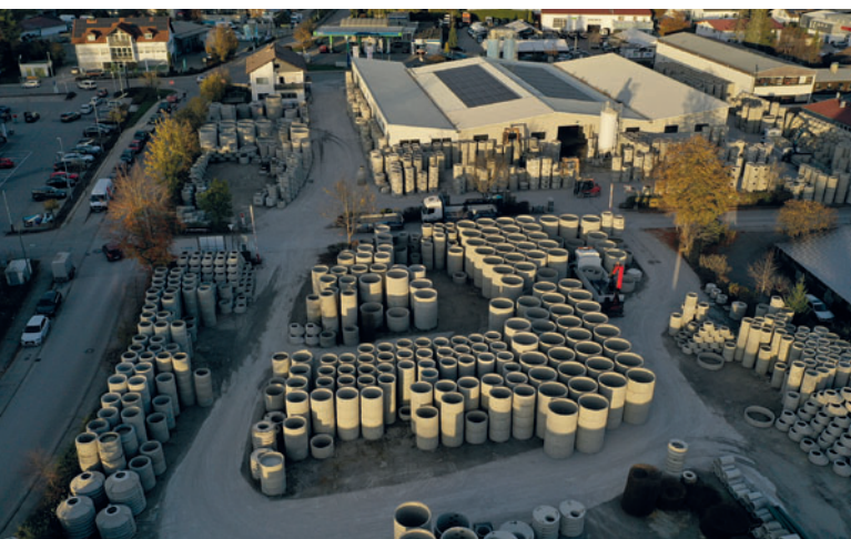
Бетонный завод Kühne в Геретсриде, недалеко от Мюнхена

Schlüsselbauer Technology GmbH & Co. KG Hörbach 4, 4673 Gaspoltshofen, Austria T +43 7735 71440 sbm@sbm.at www.sbm.at