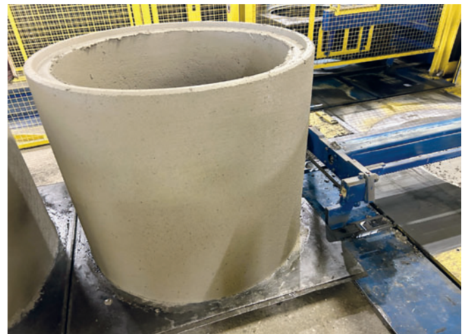
Свежеотформованное изделие выгружается из машины на поддон

Готовые изделия перемещаются по двум направляющим перед прессовальной станцией. От одного цикла к другому изделия на поддонах постепенно продвигаются вперед, пока не достигнут станции приемки. Там другой оператор с помощью электрического транспортера перемещает изделия из буферной зоны производственной системы в крытый склад для затвердевания. Электрический транспортер сконструирован таким образом, что на