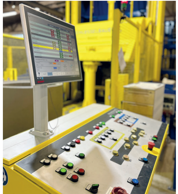
Удобный контроль производства с панели управления

Установка Magic от Schlüsselbauer Technology, которая эксплуатируется на заводе Kühne, является универсаль-